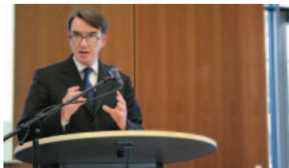
EU-Handelskommissar Peter Mandelson beim BDI in Berlin