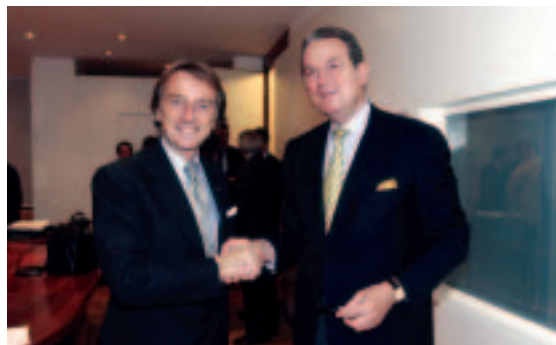
BDI-Delegationsreise nach Italien: BDI-Präsident Jürgen R. Thumann mit dem italienischen Minister für Industrie, Claudio Scajola und Confindustria-Präsident Luca Cordero di Montezemolo