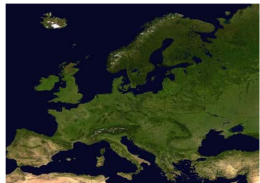
Europa – Hoher Standortwettbewerb auf engem Raum

Unternehmen, die grundlos Arbeitsplätze verlagern, sollen für einen Zeitraum von mindestens sieben Jahren von der EU-Strukturförderung ausgeschlossen werden. Straßburg fordert zudem, bei „zweckwidriger Verwendung“ sollten die Mittel auch zurückgefordert werden. Der Bericht spricht sich dafür aus, Überwachungssysteme einzurichten wie etwa die Beobachtungsstelle zur sozialen Situation in Dublin. Schließlich fordert das Parlament einen „europäischen Verhaltenskodex“.