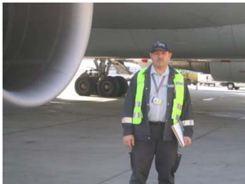
Fraport-Mitarbeiter sorgen für die Sicherheit im Flugverkehr. komba kümmert sich um die Belange der Beschäftigten.

96/67/EG – Dieses Kürzel steht für eine europäi-sche Richtlinie. Richtlinie 96/67/EG über den Zugang zum Markt der Bodenabfertigungsdiens-te auf den Flughäfen der Gemeinschaft droht zur Büchse der Pandora zu werden. Die EU-Kommission, die sich auf vielen Feldern für die Liberalisierung auch öffentlicher Aufgaben stark macht, überarbeitet den Gesetzestext zur Zeit. Ohnehin ist der Liberalisierungsdruck, der von dieser Richtlinie ausgeht, auch in ihrer aktuellen Fassung groß.