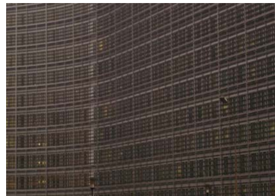
Teilansicht der Fassade des neuen Brüsseler Kommissionsgebäudes „Berlaymont“

Das Gremium soll eine Schnittstelle zwischen Kommission und wichtigen Regierungsbehörden der Mitgliedsstaaten sein. Die Stabsstelle setzt sich aus nationalen Sachverständigen zusammen, die von der Kommission auf Vorschlag der Mitgliedsstaaten ernannt werden.