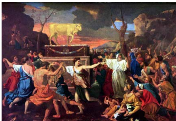
Der Tanz ums Goldene Kalb Gemälde von Nicolas Poussin (1594-1665)

der Mitgliedstaaten tanzen und das Staatsziel- diskussionen verdrängt.