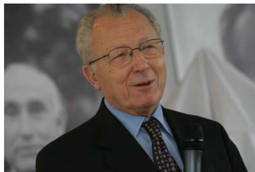
Jacques Delors im September 2006

Das Urteil Delors' und Rasmussens mag polemisch zugespitzt sein. Die erhebliche Bedeutung der Wettbewerbspolitik ist jedoch schon allein aufgrund der Kompetenzverteilung zwischen Union und Mitgliedstaaten evident. Schließlich liegen die wichtigsten Zuständigkeiten der EU-Kommission im Bereich des Wettbewerbsrechts und der Binnenmarktpolitik. Tatsächlich hebt Brüssel seit Jahren vor allem die europäische Wettbewerbsfähigkeit hervor, sieht hier die sozialpolitische Antwort Europas auf die Globalisierung.