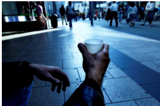
Droht Europa eine neue Pauperisierung?

In unterschiedlichem Tempo werden in praktisch allen EU-Mitgliedstaaten staatliche Aufgaben in Frage gestellt. Das gilt ganz besonders für den sozialen Bereich. In Deutschland etwa könnten die Freien Wohlfahrtsverbände, die öffentlich gefördert staatliche Aufgaben wahrnehmen, schon bald in den Sog der europäischen Wettbewerbspolitik geraten.