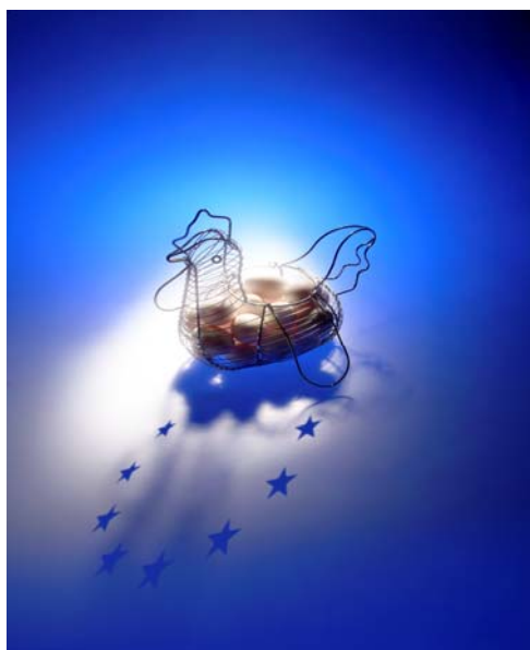
Henne und Ei

Die Europäische Union ist, so heißt es in politischen Lehrbüchern, ein Gebilde sui generis, also in völkerrechtlicher Hinsicht ein Konstrukt eigener Art. Denn sie ist weder Bundesstaat noch Staatenbund. Vielmehr weist die EU Wesensmerkmale beider auf. Ihr fehlen also Eigenschaften, die eine klare Zuordnung als Bundesstaat oder Staatenbund ermöglichen. Sie ist weniger als ein Bundesstaat und doch mehr als ein bloßer Staatenbund. Sie oszilliert gleichsam zwischen beiden.