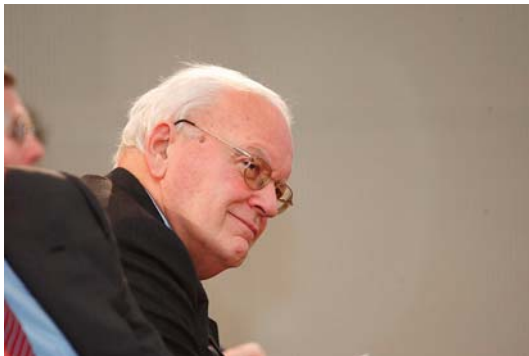
Alt-Bundespräsident Herzog

Noch aktueller und in der öffentlichen Wirkung größer ist die Kritik von Alt-Bundespräsident Roman Herzog, der zudem als ehemaliger Richter am Bundesverfassungsgericht ein exzellenter Kenner der Materie ist.