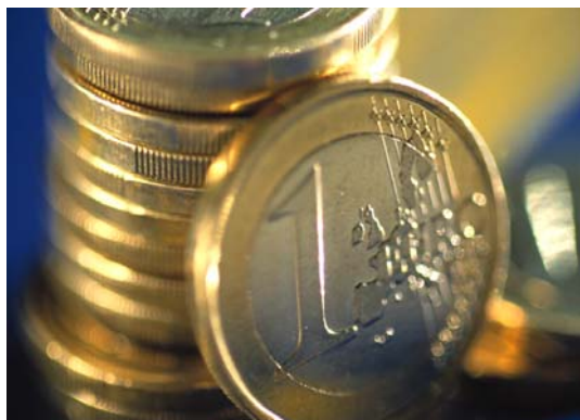
Haushaltssanierung durch PPP?

die demokratisch legitimierten Vertretungen der Gebietskörperschaften Einfluss auf die Gestaltung des öffentlichen Lebens verlieren. Denn worüber sollen die Bürger in Kommunalwahlen noch abstimmen, wenn die Kommunen kaum noch Gestaltungsspielräume haben, die unterschiedliche Politikangebote rechtfertigen würden?