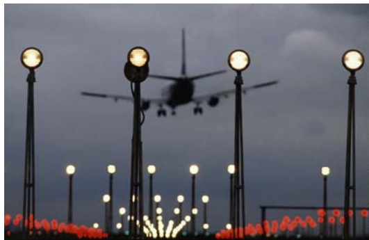
Staatliche Aufgabe Flugsicherheit

doch ist dies kein Ziel, das die Kommission mit ihren Vorschlägen verfolgt.“