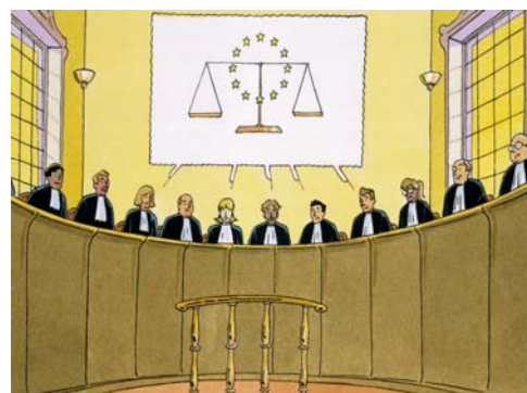
Im Kompetenzstreit hat der EuGH das letzte Wort

Während die erste Richtlinie noch vom EuGH mit der Begründung abgelehnt worden war, die Voraussetzungen für eine Anwendung von Artikel 95 EG-Vertrag seien nicht gegeben, sahen die höchsten europäischen Richter dies offenbar im Verfahren C-380/03 anders. Unterschiedliche Regelungen in dieser Frage hätten den Binnenmarkt demnach beeinträchtigen können. Dass die Richtlinie darüber hinaus auch dem Gesundheitsschutz diene, sei ebenso wenig ein Hinderungsgrund. Schließlich sei die Gemeinschaft verpflichtet, ein hohes Schutzniveau im Gesundheitswesen zu gewährleisten.